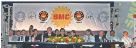
Lideranças políticas e sindicais de todo o Brasil prestigiaram o evento

Juramento de posse: honrar as antigas gerações, respeitar os estatutos, servir aos associados e manter o compromisso de um Sindicato querido pelos trabalhadores e respeitado por todos!