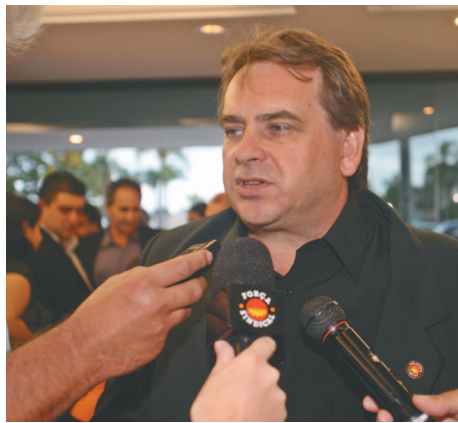
Presidente reeleito do Sindicato dos Metalúrgicos quer o trabalhador mobilizado e atuando junto com o SMC, para a categoria garantir mais conquistas

Ambos têm o dever de serem estritamente profissionais. Tem que respeitar seus contratos de traba-