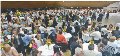
Mais de mil pessoas compareceram à cerimônia de posse

Tomou posse no último dia 7 de janeiro a nova diretoria do Sindicato dos Metalúrgicos da Grande Curitiba, gestão 2008-2012. Mais de mil pessoas compareceram à cerimônia de posse, realizada no salão social do Paraná Clube, na capital. Além de diretores, militantes, funcionários e trabalhadores da categoria, estiveram presentes no evento importantes lideranças políticas e sindicais de todo o Brasil.