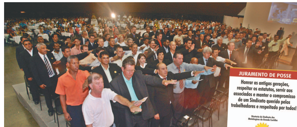
Diretoria do Sindicato durante o juramento de posse (acima), mesa com autoridades políticas e sindicais e público (abaixo).

META | Compromisso é manter o SMC como referência nacional em conquistas para o trabalhador