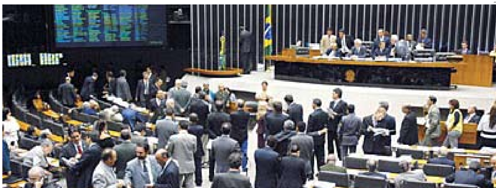
Maioria dos deputados votou contra os trabalhadores e a favor do grande capital

VERGONHA | Comissão rejeita proposta que acaba com demissões imotivadas