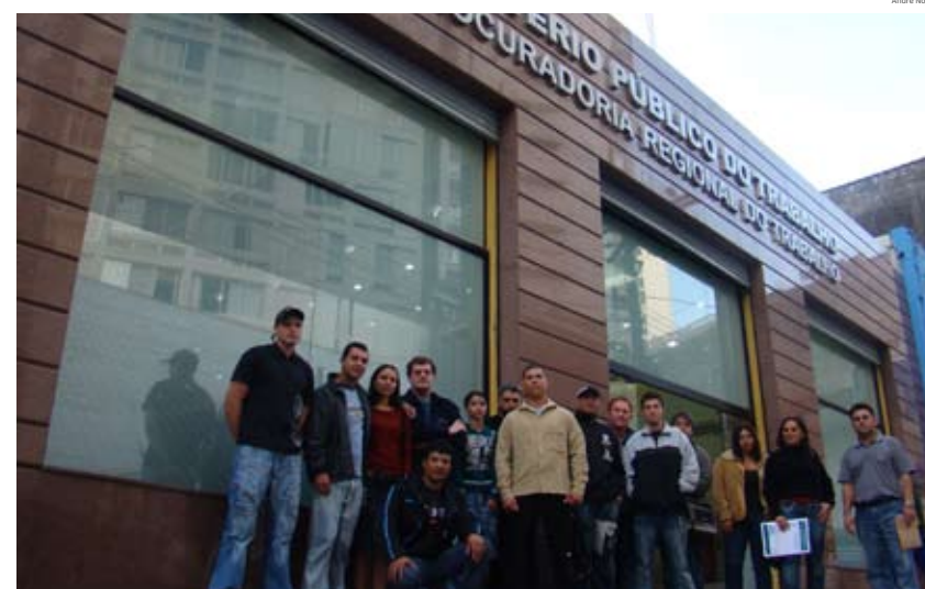
Diretores do Sindicato e trabalhadores da Açolux após audiência no Ministério do Trabalho: situação resolvida.

Devido à cobrança (muito justa, por sinal), uma diretora da empresa teve um ataque de histeria e soltou o verbo: “Querem receber? Então vão receber lá no inferno”, disse ela. A pendência foi resolvida no dia