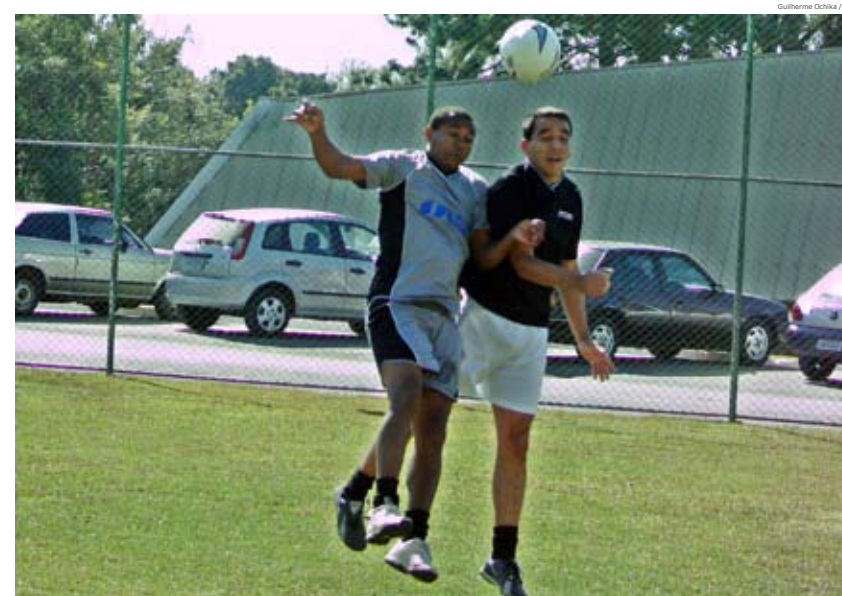
Inscrições das equipes podem ser feitas na sede e subsedes do SMC.

Estão abertas até o dia 25 de julho as inscrições para o 2º Campeonato Metalúrgico de Futebol Suíço. A competição, promovida e organizada pelo Sindicato, é voltada a metalúrgicos sindicalizados que trabalham em empresas do setor. A exemplo de 2007, esse ano a disputa será novamente por região. Você que gosta de bater uma bolinha, monte seu time, procure a subsele do Sindicato da sua área e preencha a ficha de inscrição. O torneio começa em agosto. Participe!