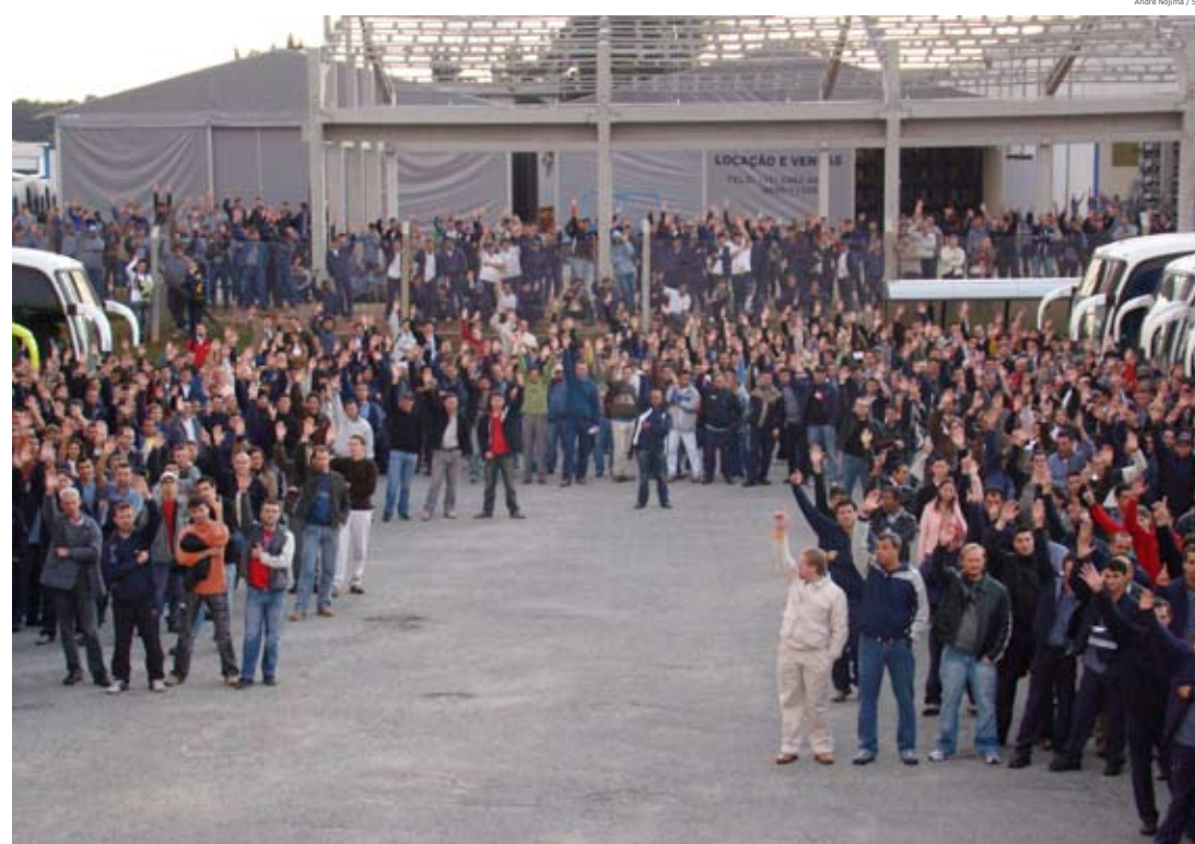
Metalúrgicos da Volvo aprovaram a PLR em assembléia no dia 14 de maio.

As negociações de PLR seguem a todo vapor na nossa categoria! Até o fechamento desta edição do jornal A Voz do Metalúrgico, no dia 11 de julho, o SMC já havia fechado 81 acordos com as empresas do setor. Vale destacar que outras 39 indústrias estão em negociação com o Sindicato. O índice coloca os metalúrgicos em posição de destaque no ranking no estado. “É a categoria que mais tem acordos no Paraná. Ao conquistar a PLR na empresa, o Sindicato cria uma possibilidade maior do trabalhador ter uma renda extra, fato esta que ajuda a economia crescer”, afirma o economista do Dieese, Sandro Silva.