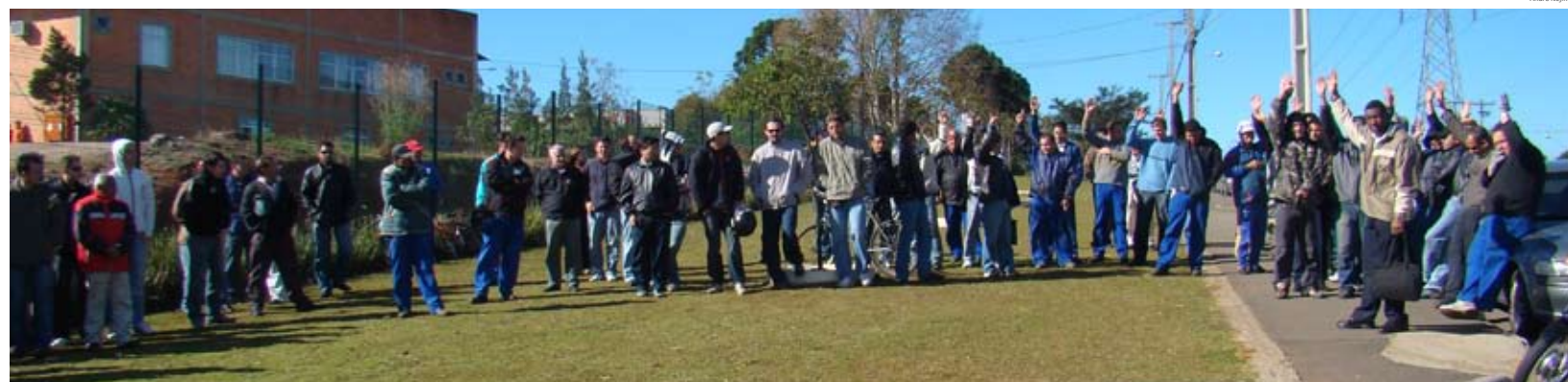
Conquistas na A1 (acima) e Omeco (abaixo) vieram depois de muita mobilização.

de paralisação, os cerca de 50 trabalhadores conquistaram a PLR 2008 e reajustes no vale-mercado e vale-alimentação. Valeu a luta!