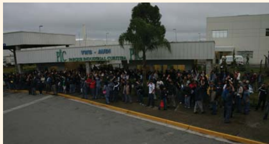
PIC DA VW/AUDI

Os trabalhadores do setor de autopeças não se intimidaram e foram para a luta! Após uma primeira proposta baixa feita pelo Sindipeças, a categoria se mobilizou, protestou, e, seguindo o exemplo das montadoras, conquistou um bom acordo de data-base. Confira abaixo os números: