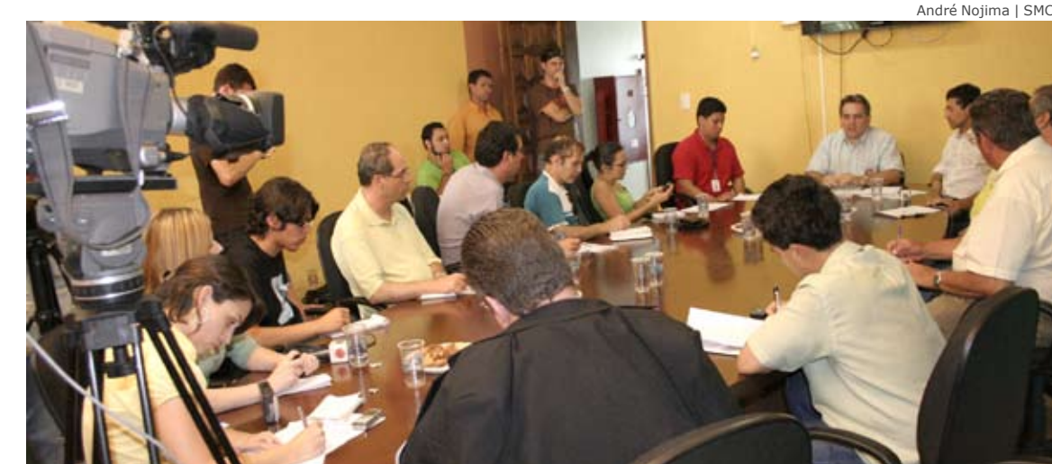
Metalúrgicos da Bosch protestam contra demissões (foto maior). SMC divulga ações para coibir as dispensas em coletiva à grande imprensa (foto menor)