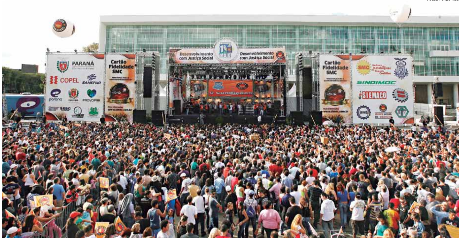
O evento da Força Paraná lotou a Praça Nossa Senhora da Salette, em frente ao Palácio Iguazu