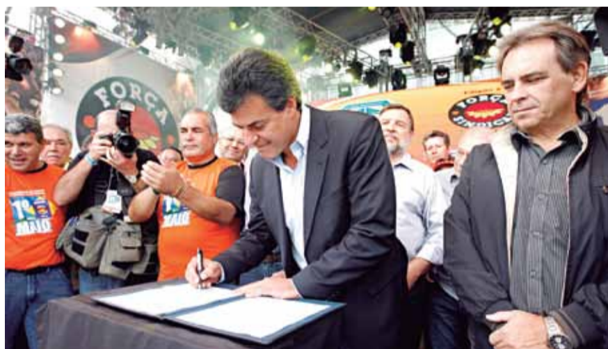
Governador Beto Richa sancionou o maior piso do Brasil durante evento da Força