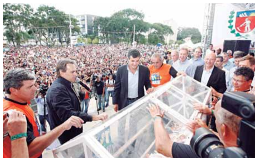
Sorteio de prêmios garantiu a arrecadação de 41 toneladas de alimentos

Na parte da tarde quem participou do evento pode assistir o show de várias duplas sertanejas e, no final