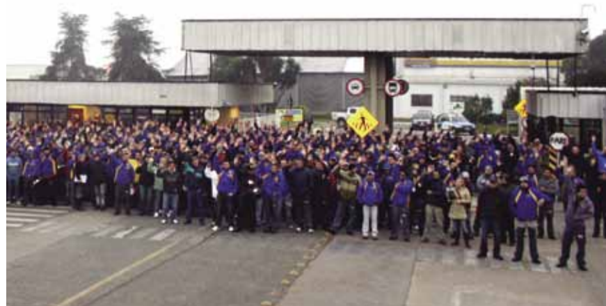
Metalúrgicos da CNH se espelham na Volks, e também conquistam "Pacotão"