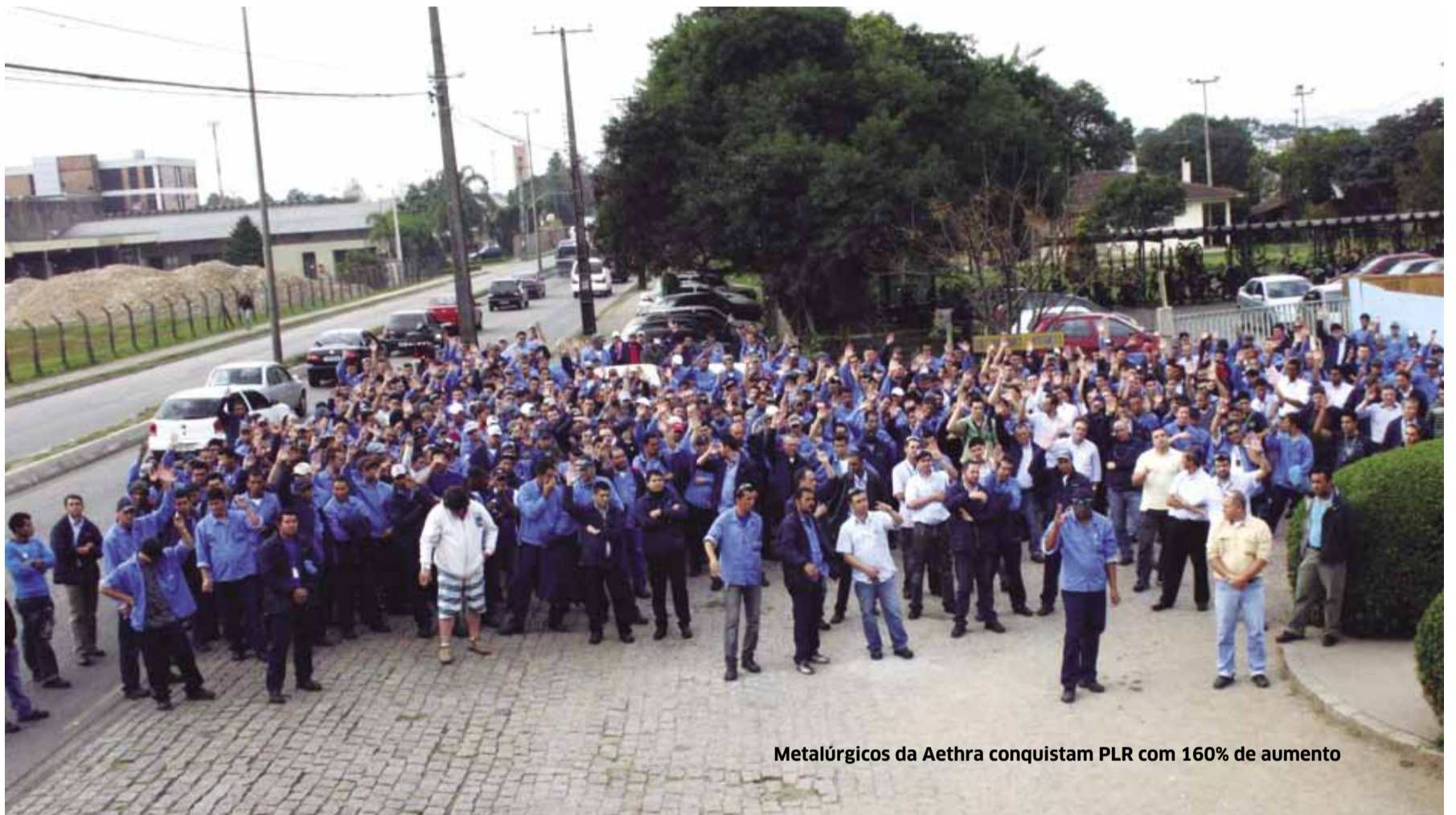
Metalúrgicos da Aethra conquistam PLR com 160% de aumento

A luta pela Participação nos Lucros ou Resultados (PLR) segue com força total! O benefício já foi alcançado por trabalhadores de mais de 70 empresas. A mobilização dos trabalhadores deu resultado e mostrou que onde há luta, há conquista! Mas a batalha não para por aí: mais de 50 fábricas ainda estão em negociação com o Sindicato