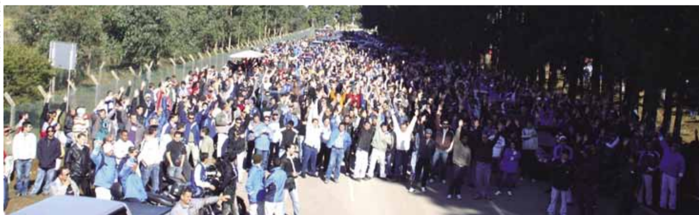
Com greve mais longa da Volks no mundo, trabalhadores conquistam "Pacotão" de benefícios

Após 39 dias de luta exemplar, trabalhadores da Volks conquistaram a PLR 2011, a primeira parcela da PLR 2012, data-base, abono salarial, reajuste da tabela salarial e adiantamento da 1ª parcela do 13º salário de 2012. Confira em detalhes o acordo conquistado na página 3.