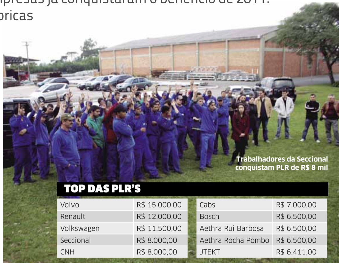
Trabalhadores da Seccional conquistam PLR de R$ 8 mil

Essa luta por todos os lados da Região Metropolitana repercutiu em todo o Brasil, como exemplo de mobilização. Mas, é bom lembrar também que a batalha da PLR não acabou. Mais de 50 empresas ainda estão em negociação com o Sindicato. Portanto, continuamos alerta e com o bom e velho ditado: Quem luta mais, conquista mais!