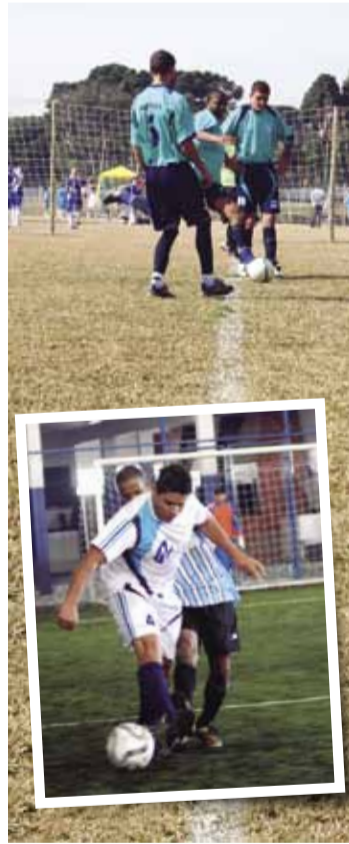
Campeonato já começou a todo o vapor

"Gol!" Este grito já foi emitido mais de 140 vezes no Campeonato Metalúrgico de Futebol de 2011, mais especificamente nos dias 29 de maio em Pinhais e 19 de junho CIC, Araucária e Sede central balançarem as redes no último dia 19 de junho. Em breve será a vez dos metalúrgicos de São José dos Pinhais e Campo Largo mostrarem seu talento dentro das quatro linhas. Quer ficar por dentro do que acontece no Campeonato? Então acesse o simec.com.br e acesse o link do Campeonato!