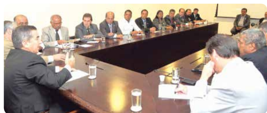
Dirigentes das centrais durante reunião com o governo

detentoras de lucros astronômicos e de várias outras fontes de renda sejam isentas, e o trabalhador tenha que pagar para poder receber este benefício. Só pra dar um exemplo, o setor automotivo recebeu R$ 26 bilhões em ajuda do governo. Já os trabalhadores precisam pensar para conseguir alguma coisa. Ganhamos uma batalha. Mais ainda falta vencer a guerra. A mobilização continua!