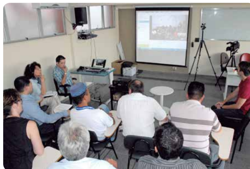
"Sindicato dos Metalúrgicos de Curitiba é referência de luta seguida pelos metalúrgicos norte-americanos", afirma o diretor da United Auto Workers.

Diante disto o SMC planeja aprovar em assembleias a solidariedade dos metalúrgicos daqui aos trabalhadores de lá, e fortalecer esta luta nos comitês internacionais.