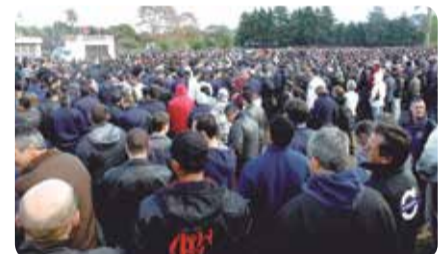
Trabalhador que foi pra luta pelo acordo por empresa garantiu bons reajustes e benefícios