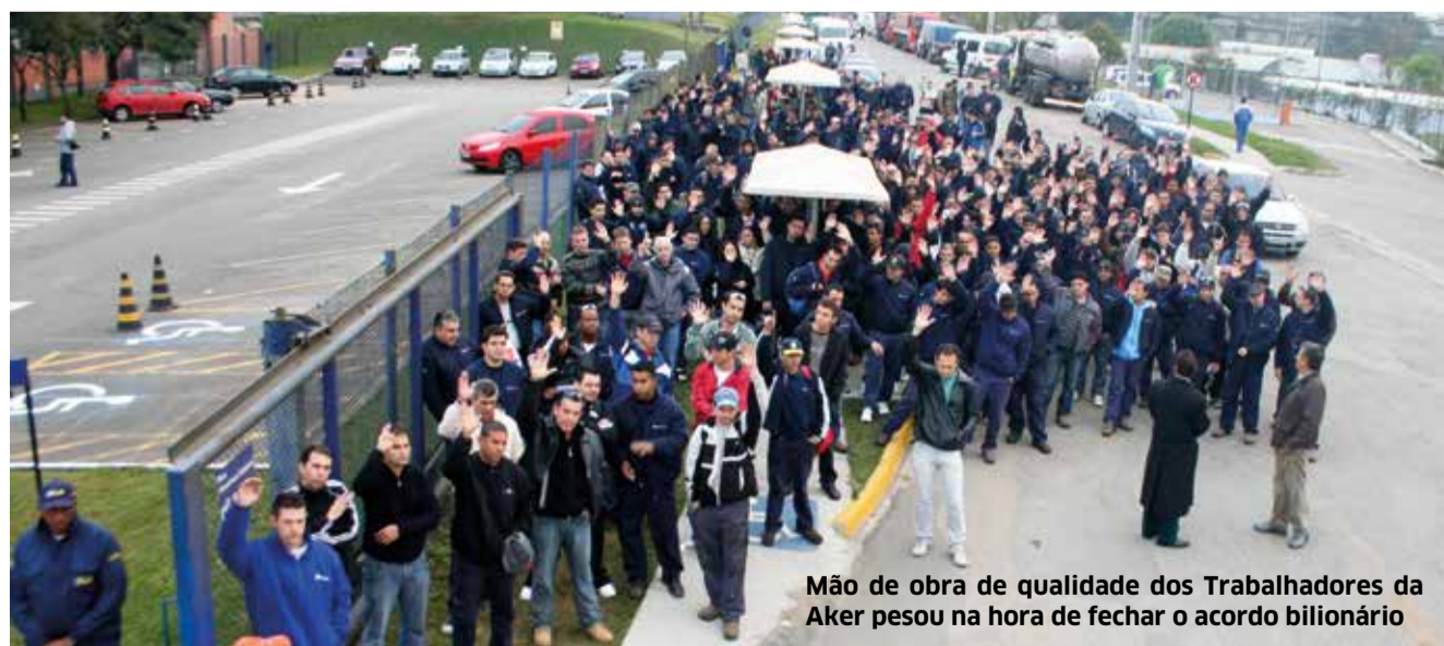
Mão de obra de qualidade dos Trabalhadores da Aker pesou na hora de fechar o acordo bilionário

SMC LEMBRA DIA EM MEMÓRIA ÀS VITIMAS DE ACIDENTE DE TRABALHO