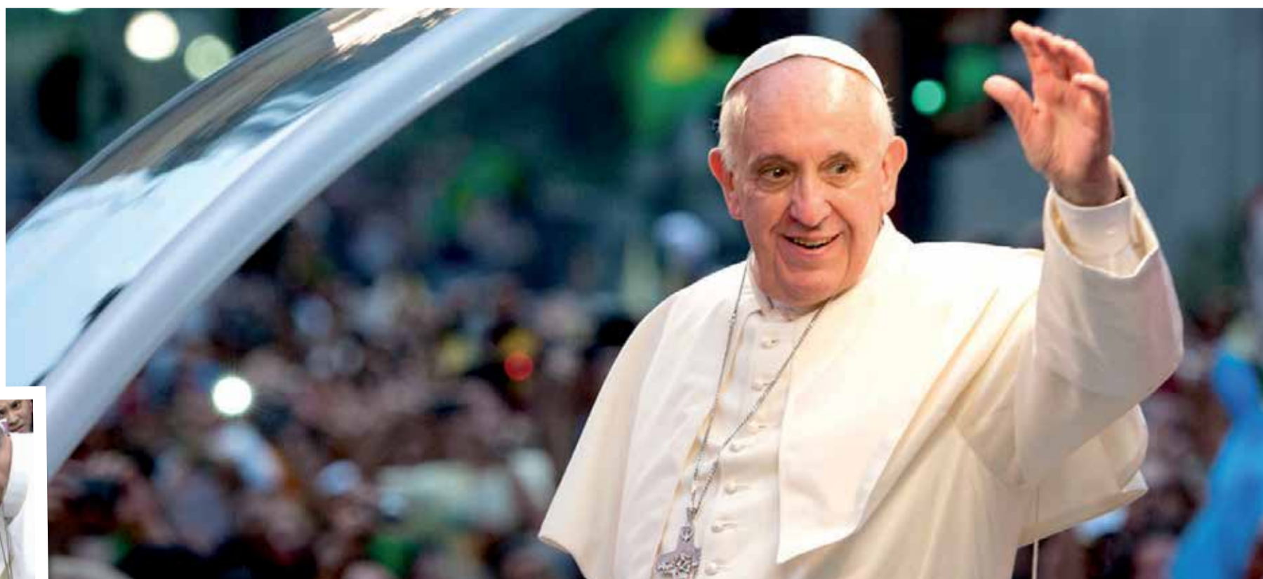
Papa enfatizou aos milhões de jovens a lutarem contra as injustiças e por um mundo melhor

Igreja e trabalhadores na luta por um mundo melhor: A postura do Papa Francisco de que não podemos nos calar diante das injustiças e sim lutar por um mundo melhor cimenta uma parceria antiga entre a Igreja e as organizações trabalhistas na luta contra a exploração humana. Assim como o Sindicato não cansa de dizer, também para o Papa a transformação da humanidade em uma sociedade mais solidária, justa e democrática só vai vir com a união e a luta de todos. Estamos na luta, Santo Padre!