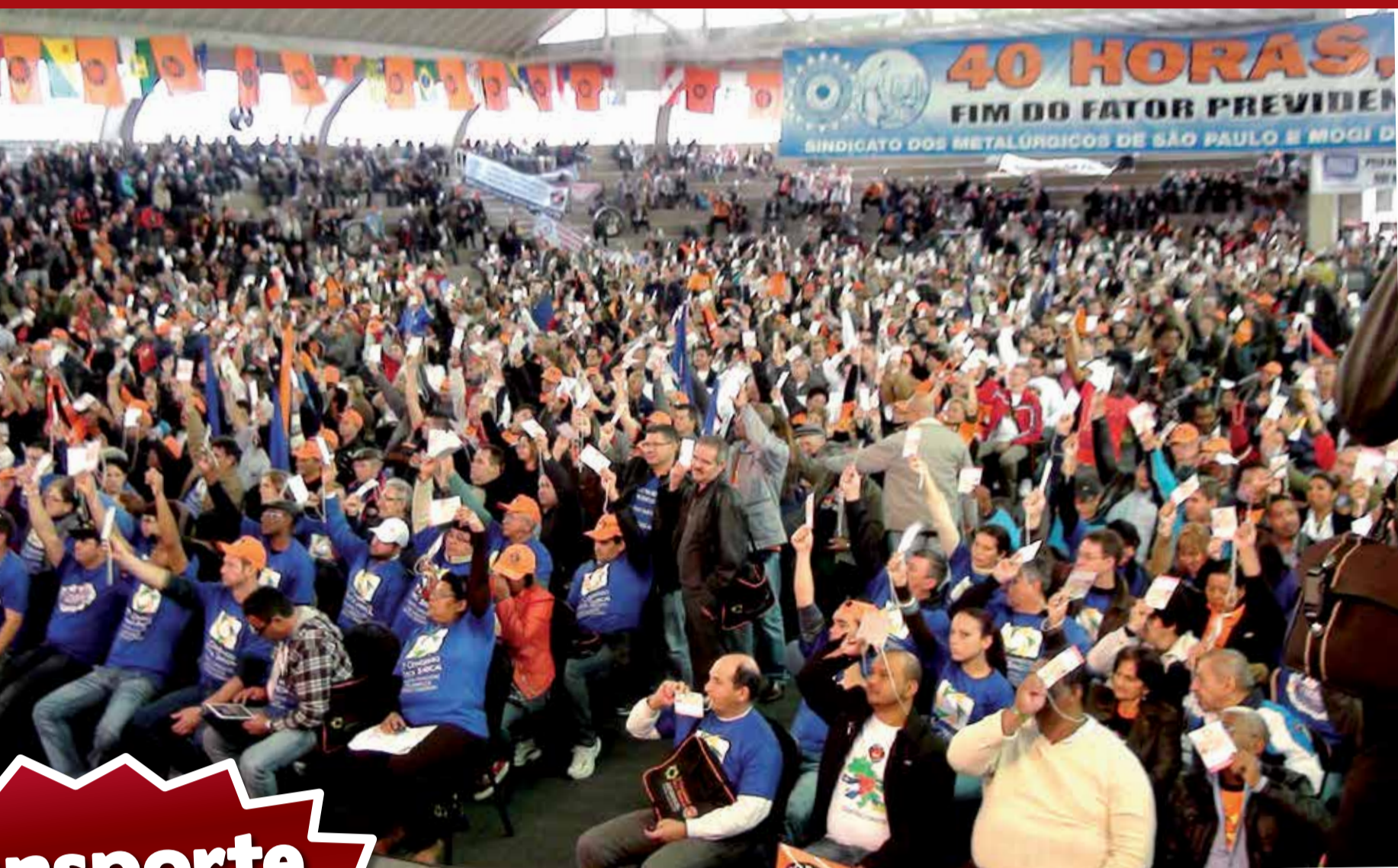
Ou vai ou racha: Durante Congresso Nacional da Força Sindical trabalhadores decidem dar ultimato ao presidente. Ou ela atende nossas reivindicações ou dia 30 o Brasil vai parar