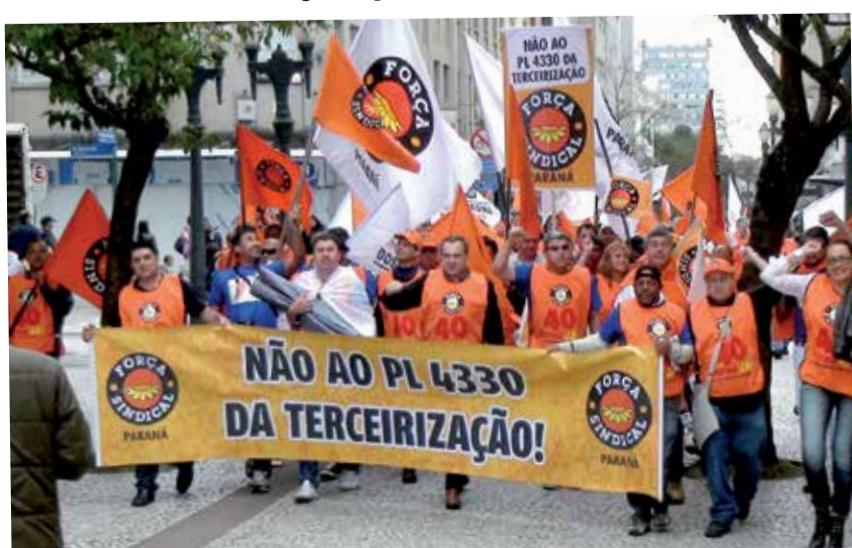
Trabalhadores foram pra rua exigir menos terceirização e mais empregos diretos

Ou o governo negocia, ou dia 30 tem greve geral