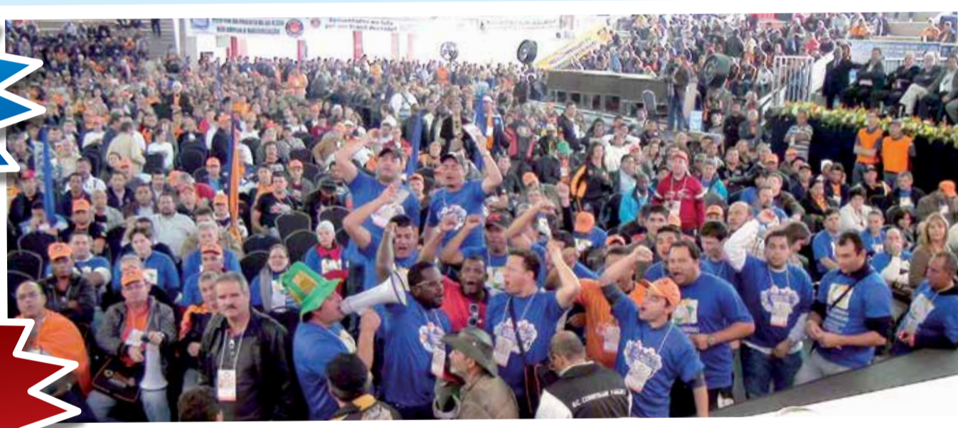
Diretores do departamento da Juventude do SMC reivindicam cota de 10% para jovens durante congresso! Conquista alcançada

Os metalúrgicos da Grande Curitiba tiveram participação decisiva no Congresso Nacional da Força. Diretores do nosso sindicato se mobilizaram e ajudaram a aprovar duas propostas importantes: a conquista da cota de 10% para jovens e 30% para mulheres na direção da central, tanto em nível estadual quanto nacional. A plenária aprovou também outras bandeiras significativas, como o fim da PL 4330 que amplia a terceirização e a criação da Secretaria Nacional das Empregadas Domésticas. Valeu a luta!