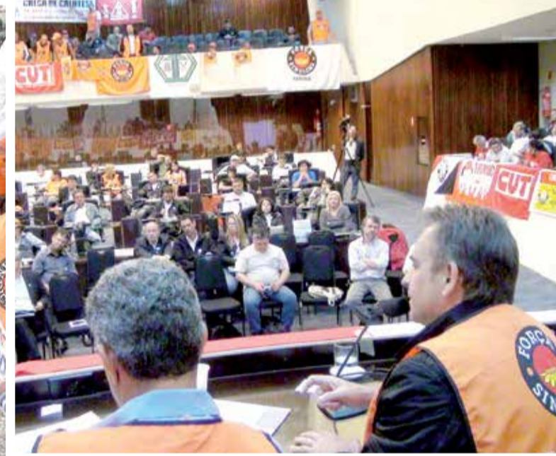
O Sindicato junto com a Força Paraná tem aumentado as manifestações para denunciar a armadilha que é a PL 4330 para os trabalhadores