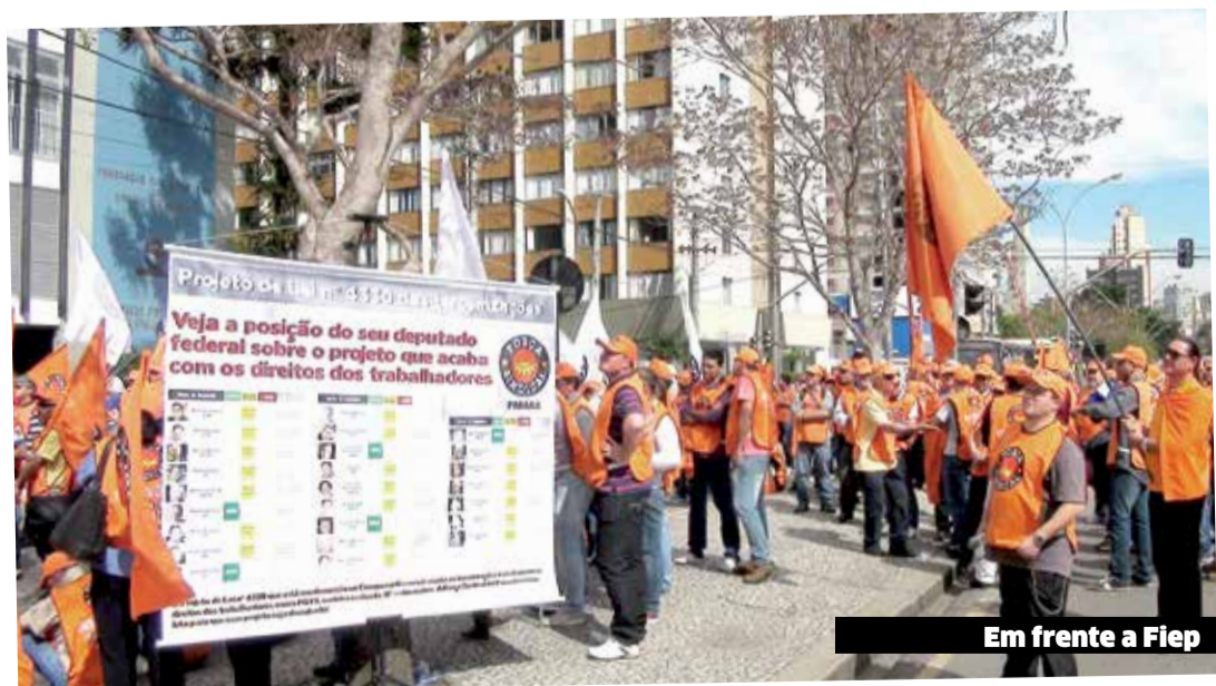
Em frente a Fiep