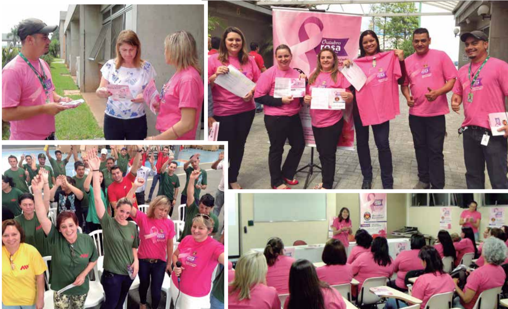
O Sindicato está nas fábricas realizando palestras e informando as trabalhadoras sobre a necessidade de prevenção. Quem leva o comprovante do exame preventivo ganha uma camiseta

Campanha Outubro Rosa, da Força Sindical do Paraná, está sendo realizada pelo Sindicato em diversas empresas da categoria. O objetivo é alertar para a necessidade da prevenção contra esse mal