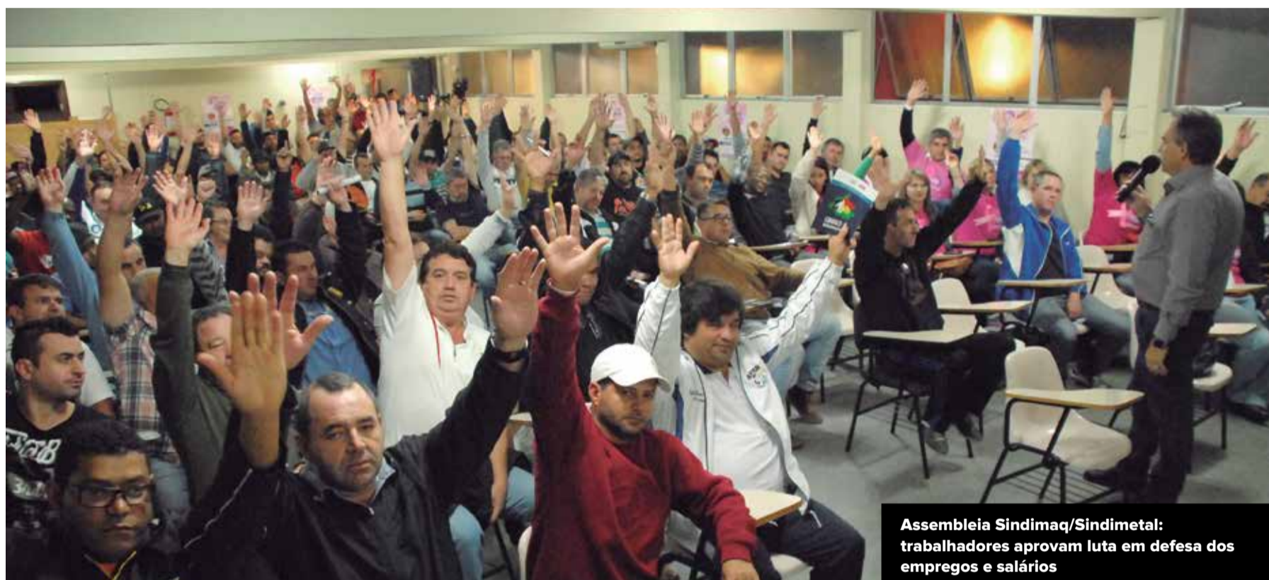
Assembleia Sindimaq/Sindimetal: trabalhadores aprovam luta em defesa dos empregos e salários

Não tem outro jeito! Com a crise apertando o calco do país, temos que concentrar nossos esforços para manter aquilo que já conquistamos. Por isso, os trabalhadores que participaram da assembleia de Máquinas e Metalurgia, no dia 26 de outubro, na sede do Sindicato, definiram que a luta esse ano vai ser para preservar os empregos e a renda dos trabalhadores. E, mais do que nunca, agora é a hora da categoria estar bem unida para saber se posicionar contra as ações tanto do governo, como do capital, que acham que para enfrentar a crise é preciso arrochar salários e direitos. A hora é de união e mobilização, companheirada!