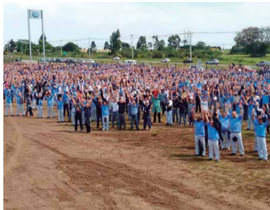
Trabalhadores aprovaram a entrada da montadora no Programa de Proteção ao Emprego, do governo federal

Trabalhadores fecharam acordo por dois anos. Além dos empregos, o importante também foi que a política de reajuste salarial foi mantida.