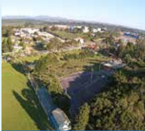
Metal Clube de Campo - SJP