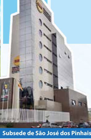
Subsede de São José dos Pinhais