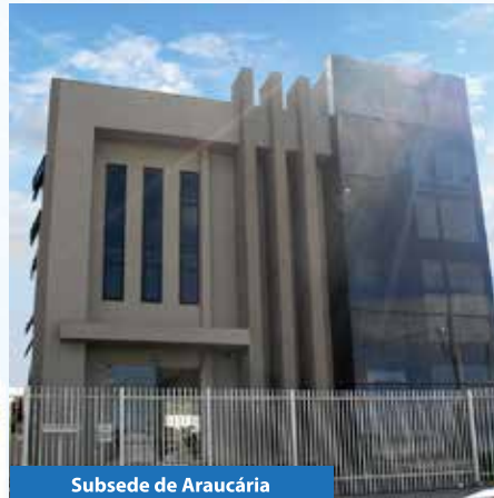
Subsede de Araucária