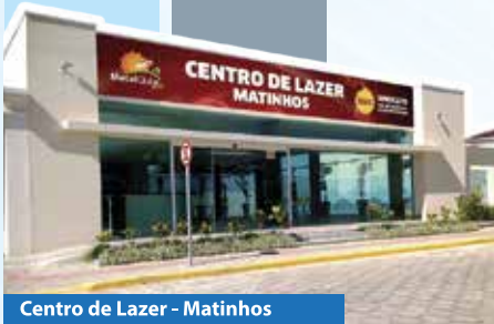
Centro de Lazer - Matinhos