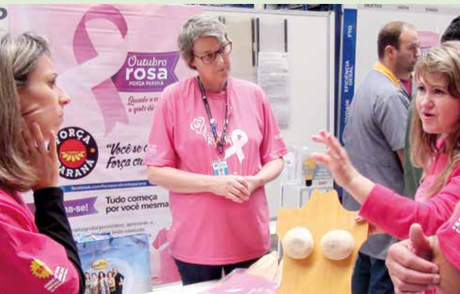
Outubro Rosa contra o câncer de mama