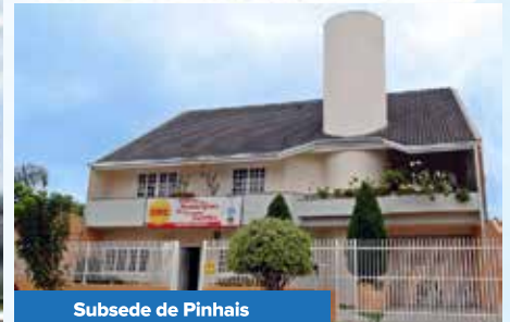
Subsede de Pinhais