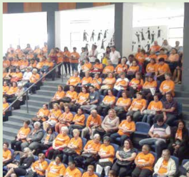
Projeto Março Laranja de combate à violência contra a mulher