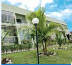
Formar - Guaraqueçaba