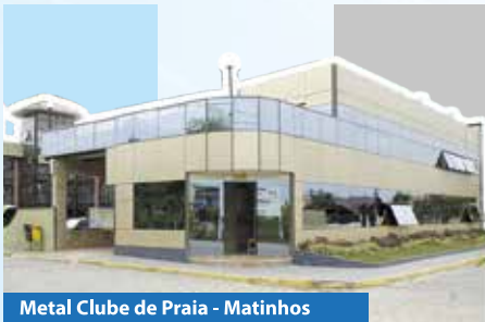
Metal Clube de Praia - Matinhos